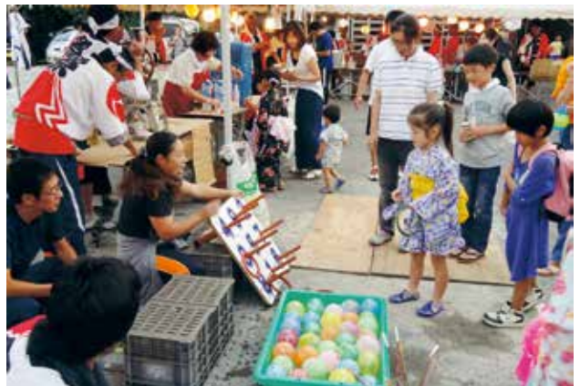
盛大に開催された夏祭り