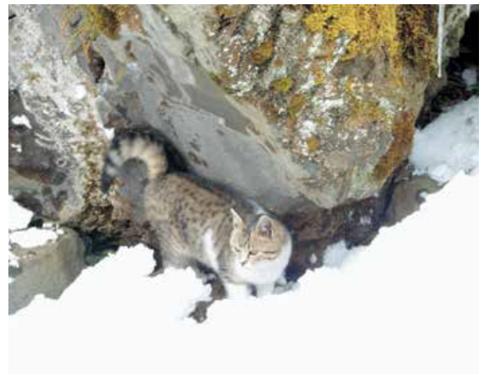
初雪を眺めるネコ／日野地区(とらじ)