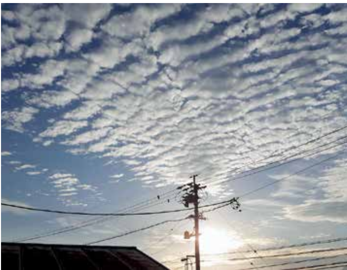
ウロコ雲／中野市内(畔)