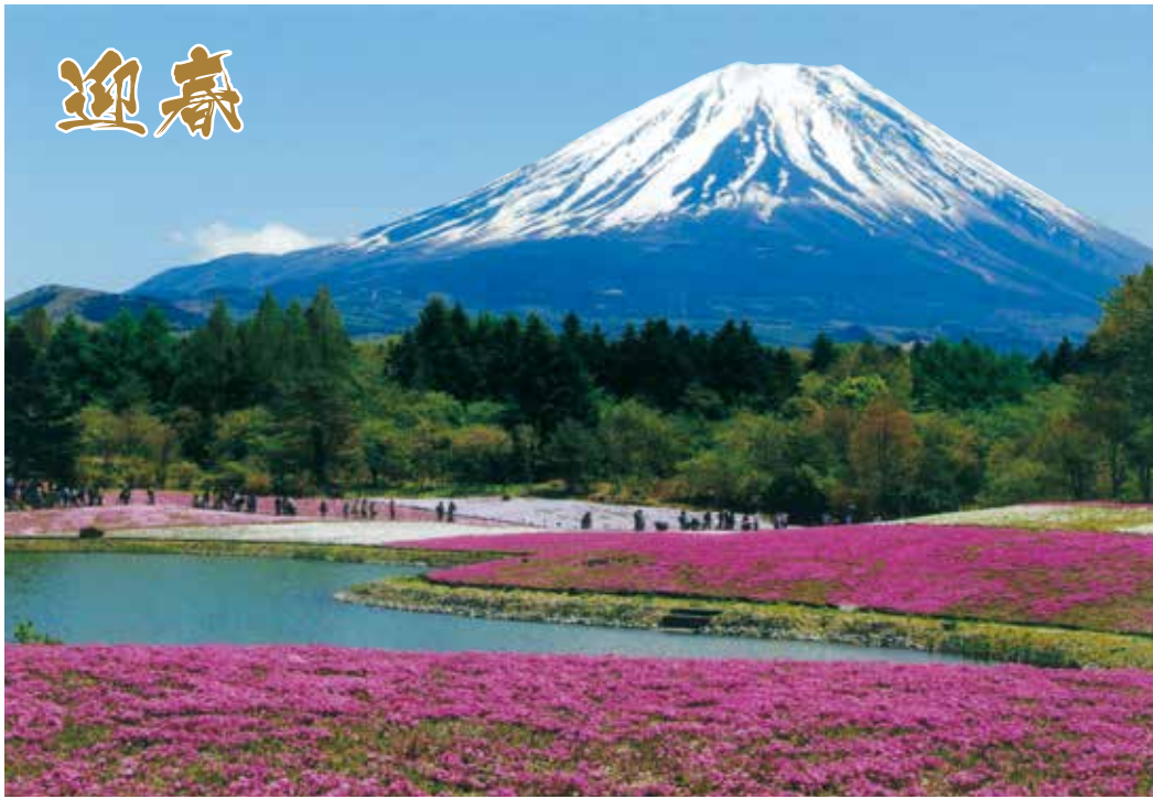
春を迎えて咲き誇る芝桜と霊峰富士