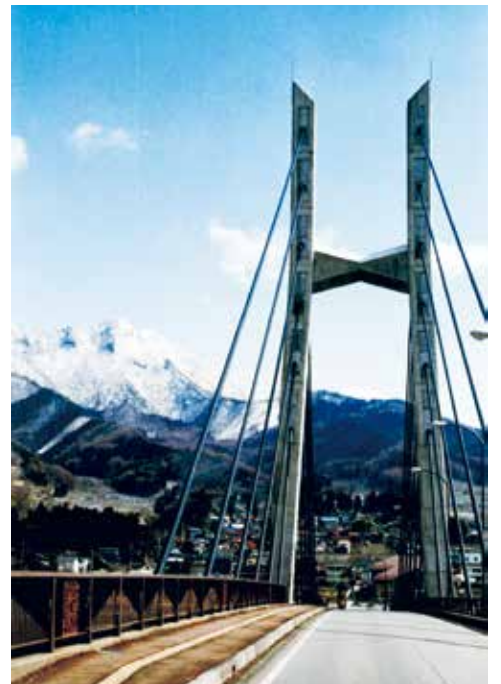
そびえ立つ（赤岩）／月岡尚雄