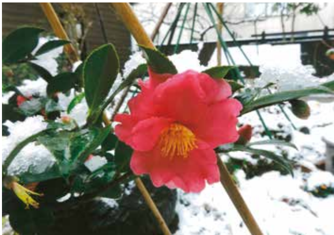
紅白…サザンカと雪（岩船）／土屋好之