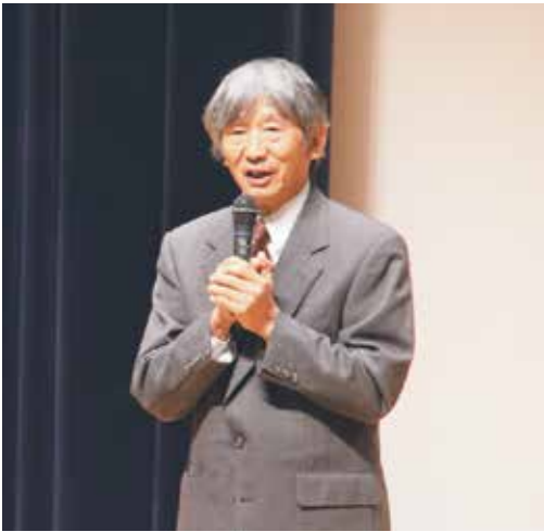
地域おこしは Be Do Buy のウィンウィンの関係を

また、地域おこしには自然と人、お客さんを迎える心が大切で、地元と来訪者や移住者との間にBe Do(その地域の居心地の良さ)、Do(その地域の行事等に参加し主役になる)、Buy(買い物をしてもらいお金を地域で使ってもらう)のウィンウィン関係が大切であるというお話をされました。「この地域には来訪者に満足してもらえる資源が豊富にある。」との言葉に、参加した皆さんは自然が豊かな郷土の良さを見直すよい機会となりました。