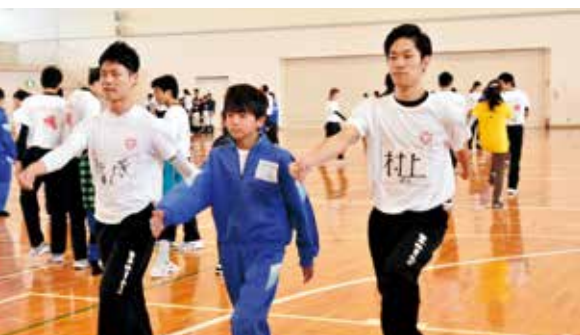
日体大の学生から指導を受ける中学生