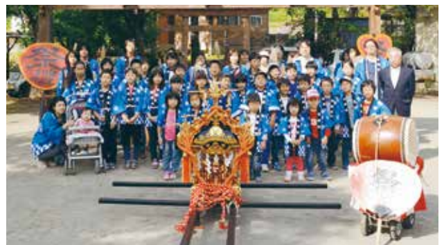
昨年の子どもみこしも大勢の参加が