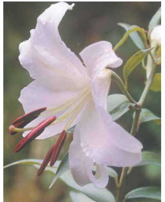
庭に咲いた山ユリ（草間）／宮澤 聡