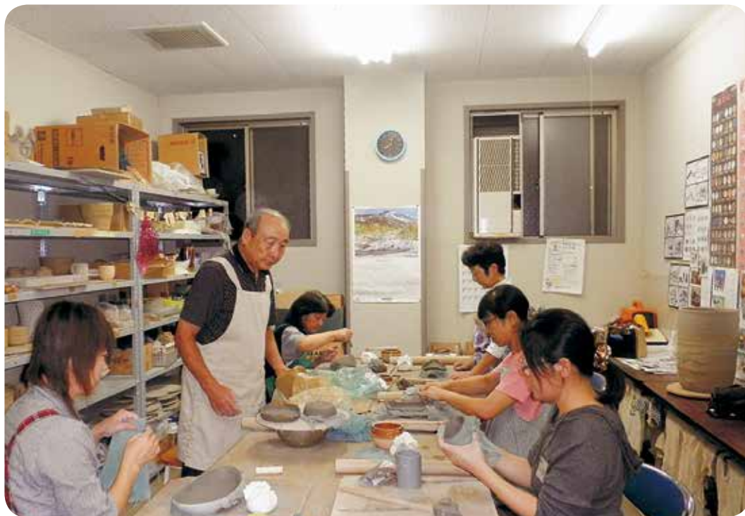
文化祭に向けて頑張ってますー