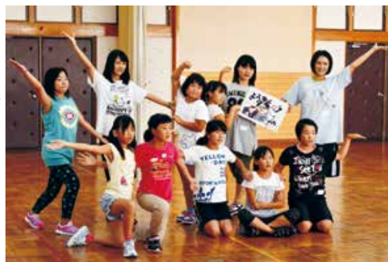
最終日の通し稽古