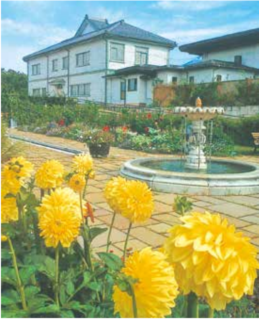
ダリアの季節（一本木公園）／月岡尚雄