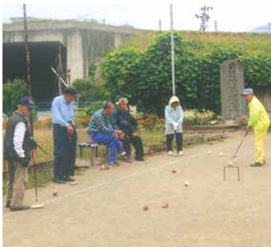
大勢のみなさん朝からがんばってます

県道安源寺く上今井線、栗林地籍の道路脇広場で同好会のみなさんが8年位前からゲートボールを続けています。天気が良ければ毎朝6時からやっています。朝日の輝きの中、スポーツをする光景は元気をもらえます。