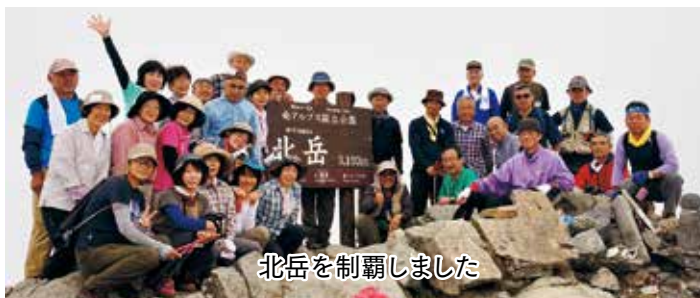
北岳を制覇しました

3日目は、宿泊場所であった北岳山頂直下の北岳肩ノ小屋から下山する日程でした。行き帰りのバスの中から甲斐駒ヶ岳などの南アルプスの山脈を眺めてきました。伊那市仙流荘の名湯も満喫することができ、有意義な登山教室でした。