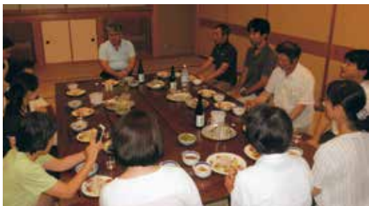
地元のお酒や食材を皆さんで楽しみました

普段当たり前のよう に食している 食材ですが、地元にもこんな美味しい食材やお酒があることを改めて感じる ことができました。