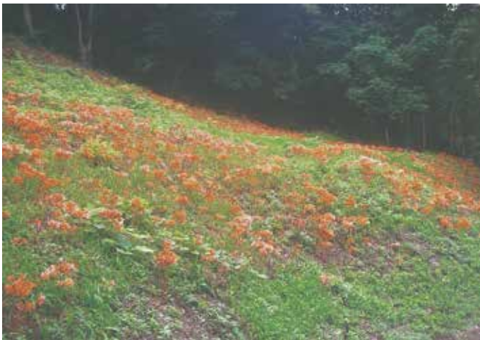
キツネノカミソリ（田麦 光林寺）／長嶺