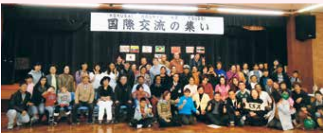
昨年は多くのスタッフが集まりました

中央公民館では外国出身の皆さんと市民の皆さんとの交流を図り、互いに異文化理解を深めていただくための「国際交流の集い」を開催するにあたり企画・運営などをしていただき、実行委員およびボランティアスタッフを募集しています。