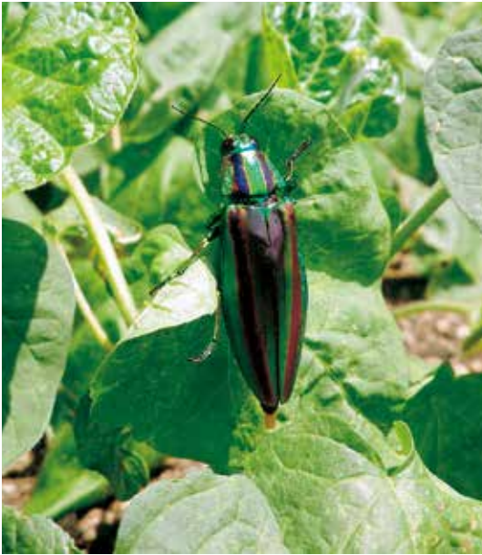
タマムシ／中央公民館前