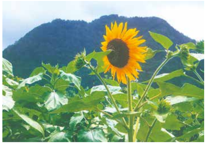
ヒマワリと箱山／一本木 月岡尚雄