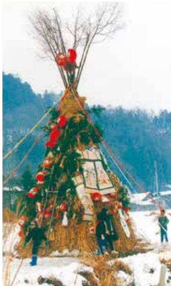
作業は半日ばかり

昔、田上区では児童が中心になり、毎年1月15日に、道陸神 どうりくじん を行っていました。昭和48年、有志により、「田上道祖神復活会」を発足し、道陸神を復活させました。その後は、児童、PTAが中心になり、毎年行われるようになりました。昭和55年には、田上道祖神復活会が、道祖神の本尊を建立しました。現在は、児童、PTA、田上道祖神復活会、分館、消防団員等多くの方々の協力のもと、田上区の子どものため、地域の活性化のために道陸神を行っています。