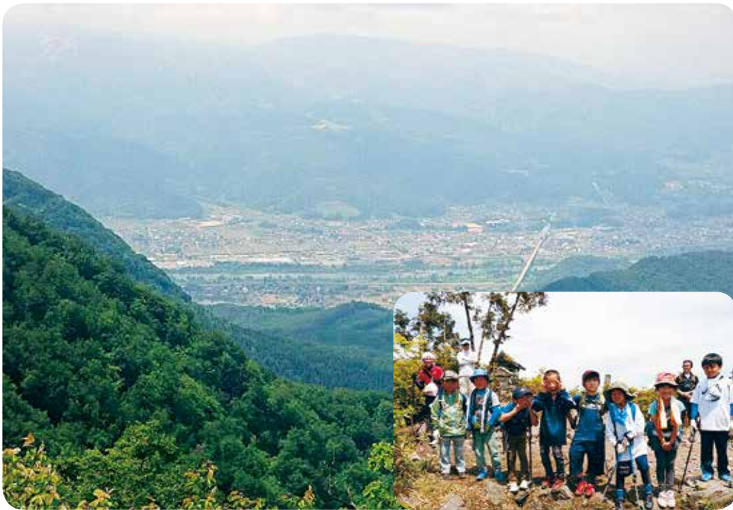
高社山の山頂にやっと到着しました