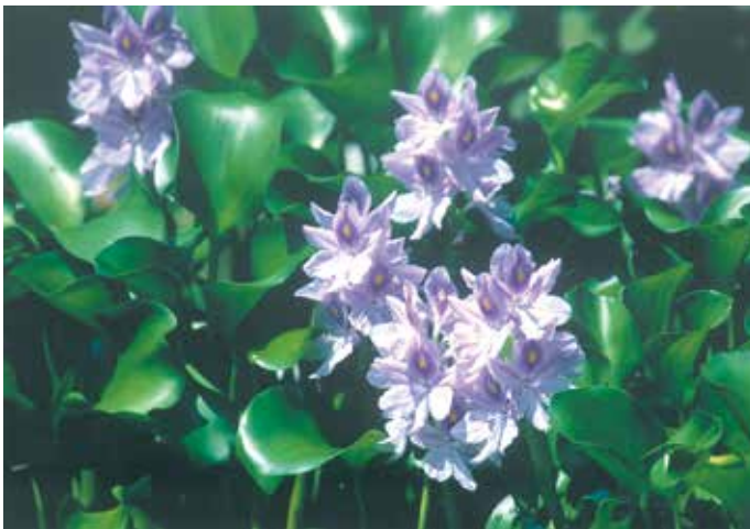
ホテイソウ／草間 宮澤 聡