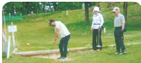
多くの区民が参加したマレットゴルフ大会