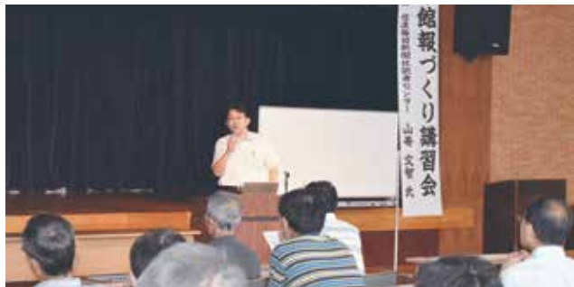
今年は31名の参加者が

今回の講習会で得たものを今後の分館報づくりに活かしていただき、1月に行われる「分館報コンクール」入賞を目指し頑張ってください。