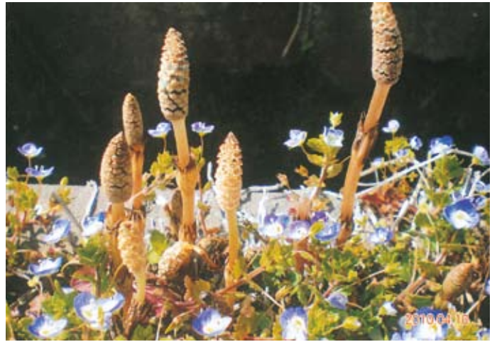
ツクシとオオイヌノフグリ／草間（月岡尚雄）