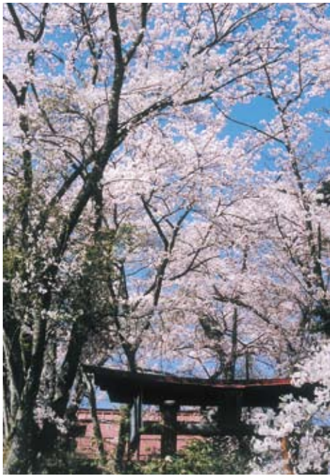
春爛漫／壁田城山（倉田昭平）