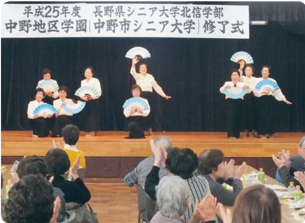
おどりクラブ 浜辺の歌の発表