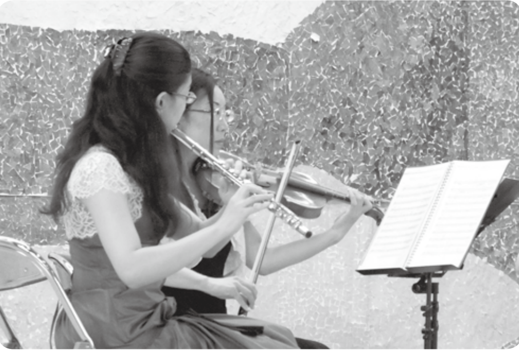
フルートカルテットの演奏