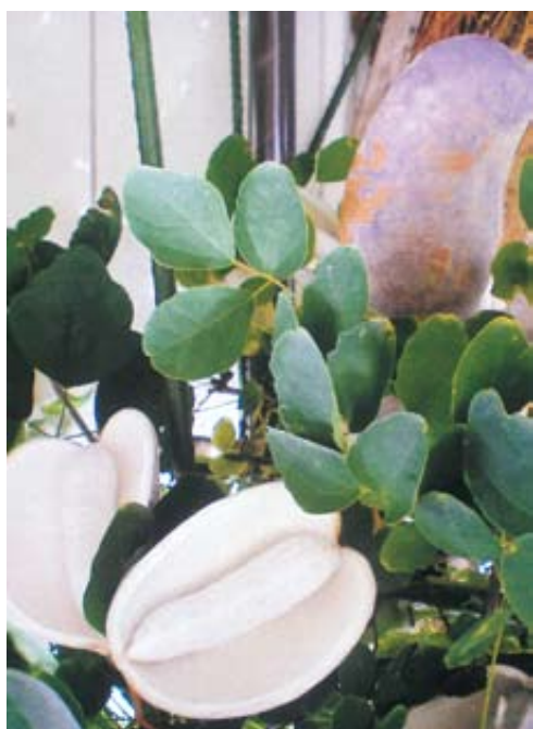
アケビ／松川 (月岡尚雄)