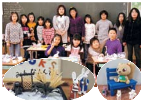
アート工作クラブの子ども達と図書館にある愉快的な作品

「自分も貢献していない年となつたかな。被災地のボランティアもあら提供できるボランティアもあるかな」と語ってくれました。