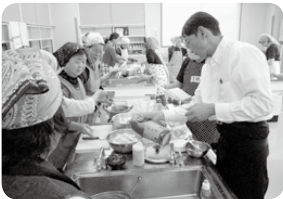
小島シェフの味付け

合わせ冷と温を考え、自然界の生命力を取り入れ、不要物を体内から出す事を考えます。これにより老化防止が図れます。この効果は旬の食材にも多くあります。