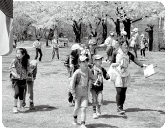
春はお花見ウォークラリー

と様々です。低学年の 頃は元気過ぎるやん ちゃ娘も、高学年にな ると頼れるお姉さんにな る。お兄ちゃんの影に隠れ てばかりの弟も、回を 重ねるとリーダーへと 成長しています。 冒険したくなったら 是非、参加してみて下 さい。子どもと遊ぶの が大好きな優しいスタ ッフが、皆さんと冒険