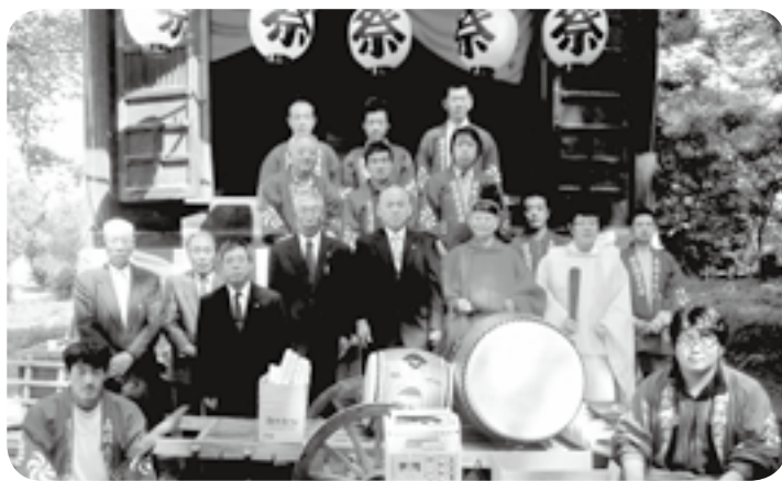
祭礼備品の魂入れ