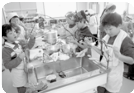
思い思いに飾り付け

西部公民館では、1月7日(土)に世代間交流事業として、まゆ玉作り講座を開催し、親子連れなど、18名が参加しました。みんなで上新粉を練って、ふかし、赤・緑・黄などの色を付け、