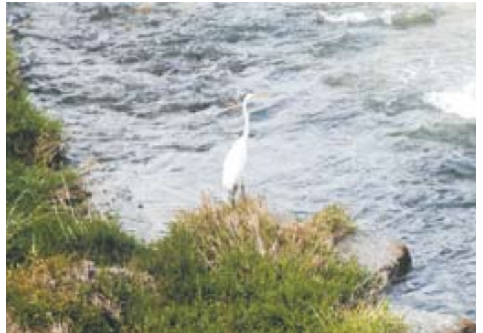
コハクチョウ／赤岩(藤澤 ゆうし 侑史)