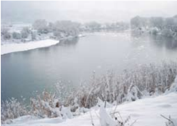
千曲川の冬景色／上今井(小林 ひかる 晃子)