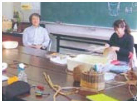
細かいけど楽しい作業

文化なかの編集委員会では、中野市内の花や季節の写真を募集します。未発表写真に限り、四ツ切りまで(ワイドサイズも可)のプリント、デジタルデータ(未加工のもの)の氏名、住所、連絡先、作品名、撮影場所、花の名前等を書き送って下さい。匿名希望やペンネーム掲載はその旨をお伝え下さい。随時募集します。