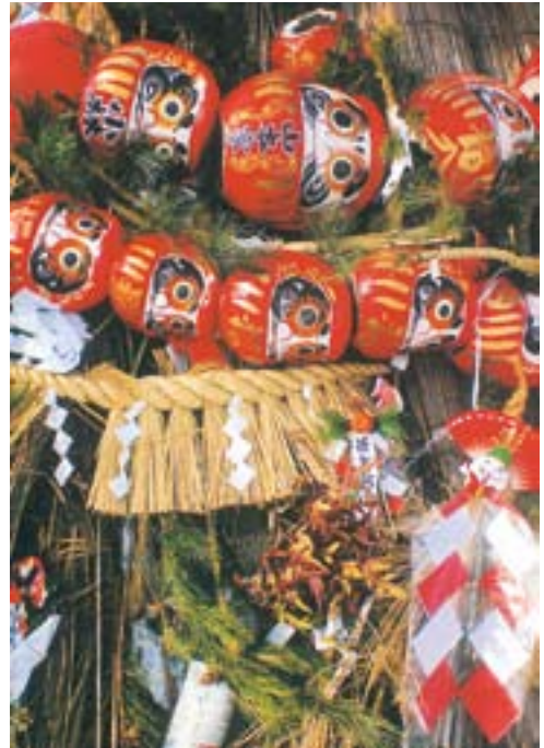
どんど焼／一本木 (月岡尚雄)