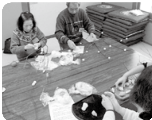
飾りを作る手元に真剣なまなざし

豊田公民館講座「ものづくり」は、信州中野ふるさと交流団の指導のもと、29名が参加し、1月7日(土)もみじ荘にて開催しました。