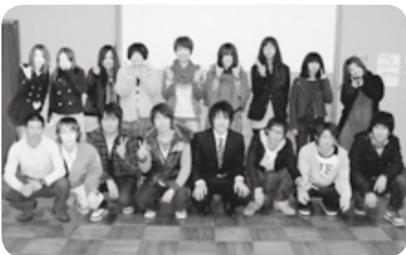
成人式実行委員会のメンバー「待ってます!!」

日時 5月4日(みどりの日) 時間 午前9時30分 受付 午前10時 開式 会場 中野市市民会館