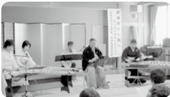
和と洋のコラボレーション

西部公民館のシニア大学では、1月6日(金)に箏・尺八・十七絃・ギターによる演奏会があり31名が参加しました。