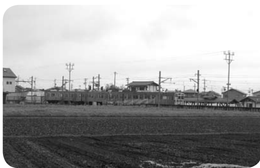
延徳駅周辺の篠井区

延徳地区の球技大会が、今季は台風のため中止となり残念でしたが、分館の球技大会は、天候にも恵まれ、終了後の慰労会も大変盛り上がりました。分館事業に御協力下さる多くの区民の皆さんに改めて感