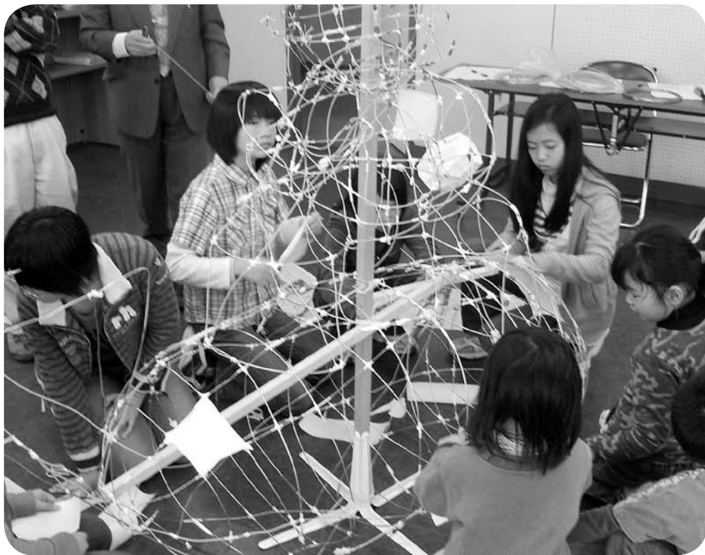
燈籠びなをつくってひな市に参加しよう～制作風景(中央公民館)