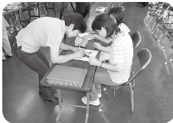
夏休み親子きりえ教室