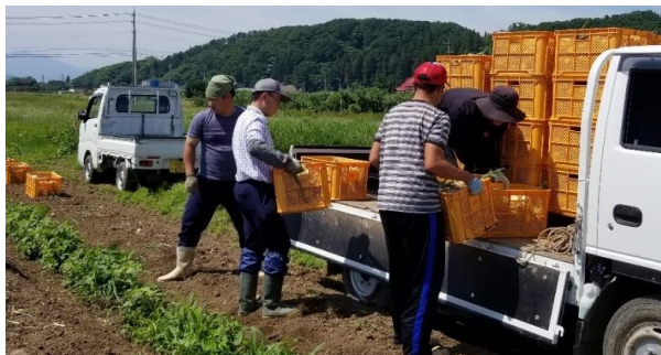
タマネギの運搬作業