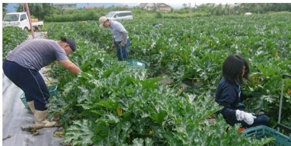
ズッキーニの収穫作業