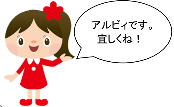
アルビス公式マスコット