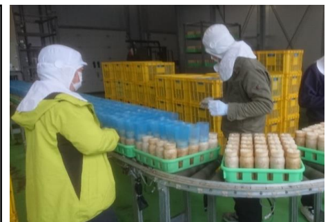
えのき筒被せ作業