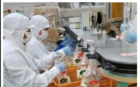
エリングフック掛け作業