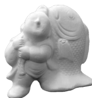
綱引き(奈良家) [たて13cm×よこ16cm]