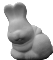
座りうさぎ [たて10cm×よこ9cm]