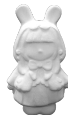
しんしゅうなかのちゃん (日本土人形資料館) [たて12.5cm×よこ7.5cm]