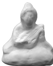
弁財天(西原家) [たて13cm×よこ12cm]