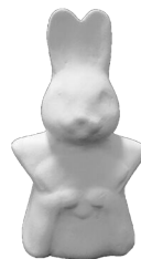
袴うさぎ (まちなか交流の家) [たて11cm×よこ6cm]