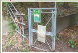
▲登山道入口。野生動物よけの柵を開けて入ります。