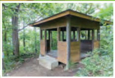
▲登り始めて10分ほどで休憩所があります。