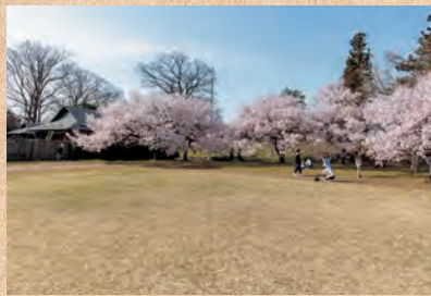
▲春には桜が咲き、多くの人が訪れる

1598(慶長3)年に主君の上杉氏に従って会津に移ったため無人となっていました。1876(明治9)年から高梨氏の子孫が敷地の一角に住宅を構え、1991(平成3)年まで暮らしていました。今は目立つ建物が何も無いので少し想像力が必要ですが、中世の武士たちの荒々しいだけではない優雅な姿が見えてきます。