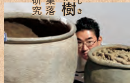
▲カメラは苦手だけど甕(かめ)は好き

考古学専攻。市内にある遺跡(集落跡、古墳、城跡など)の調査・研究と保護に取り組んでいる。