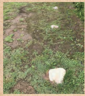
▲掘り出された会所の礎石