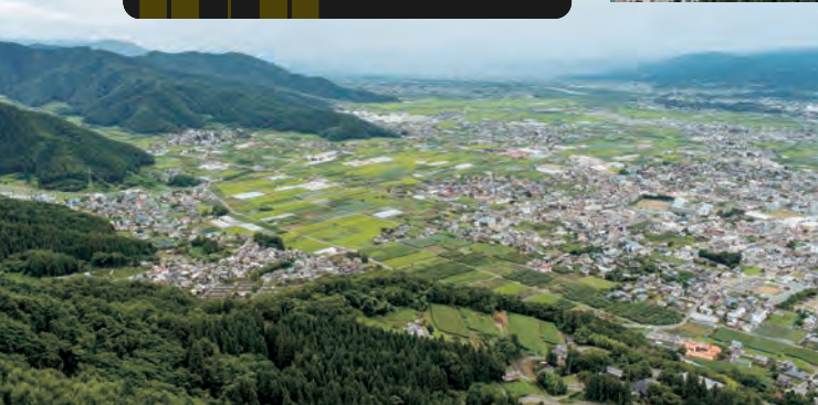
▲鴨ヶ嶽から西南方向（ドローンで撮影）