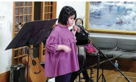
▲7月4日に中野陣屋・県庁記念館で開催されたコンサートではコロナの影響で観客と一緒に歌えない中、アドリブで手拍子を取り入れた