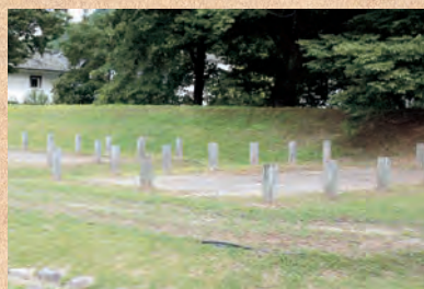
▲復元された掘立柱

なった米・麦・豆が大量に見つかっているのです。倉庫や台所だった可能性があります。