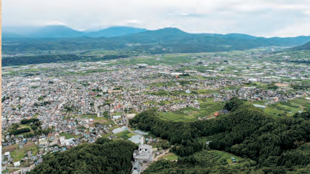
▲鴨ヶ嶽から北西方向（ドローンで撮影）

鴨ヶ嶽の山頂からは、中野市街地だけでなく、西側は善光寺平一帯を、東側は山ノ内盆地を見渡すことができます。城を築くには、絶好の場所と言えるでしょう。