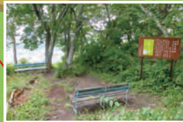
▲登山道入口から約30分で到着