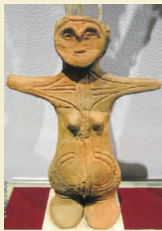
姥ヶ沢の土偶 (中野市立博物館)

大俣地区姥ヶ沢で昭和57年(1982)土地改良工事に伴う発掘調査で、縄文時代中期(約5千年前)の住居跡が発見された。多数の縄文式土器・旧石器類に混じって、27個体分の土偶の破片が出土した。そのうちの一体が、頭部・左腕部・右腕部・下半身と別々に発見されたが、ほぼ完全な形に復元された。