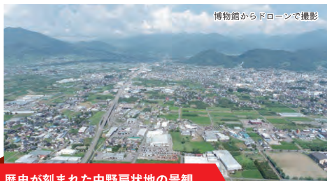
博物館からドローンで撮影

ご存知のように、博物館は長丘丘陵にあります。市街地からは少し離れていますが、この場所ならではの良さがあります。博物館に来たら、展望台の上ってみてください。東に中野扇状地、南に延徳田んぼ、西に千曲川と斑尾山、北東に高社山が見えます。ふるさとの自然・文化・歴史の舞台が一望できるのです。