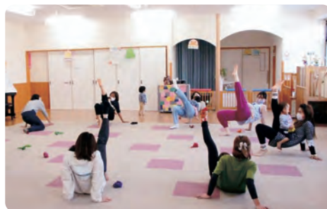
ママビクス (りんごっこ)

子育て支援センターでは、0歳から就学前までのお子さんを対象に、毎月楽しい行事を行っています。