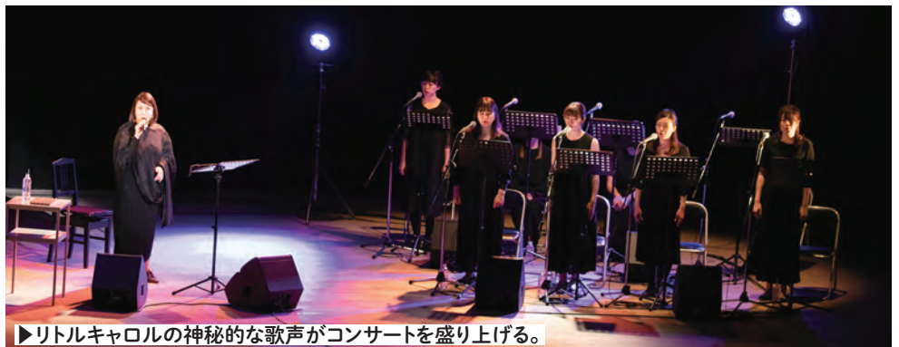
▶リトルキャロルの神秘的な歌声がコンサートを盛り上げる。