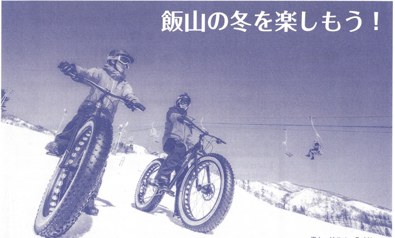
雪チャリスノーライド