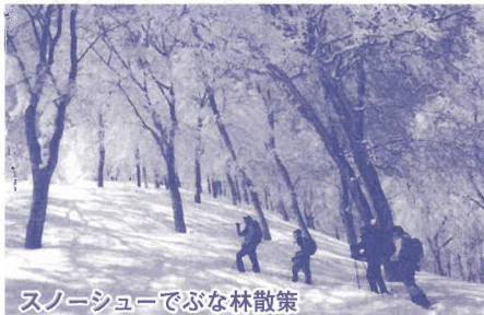
スノーシューでぶな林散策