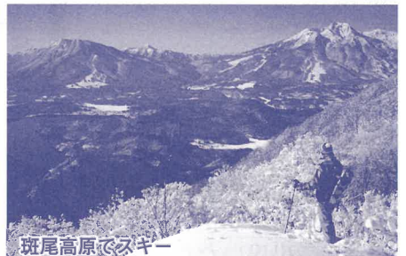
斑尾高原でスキー

豪雪地飯山の冬を楽しむには、斑尾高原スキー場や戸狩温泉スキー場でのスキー・スノーボードはもちろんですが、他にも様々なアクティビティが目白押しです。