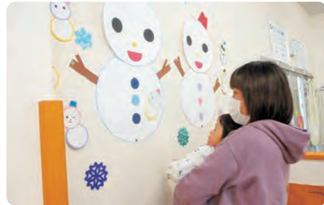
紙の雪だるまを作ったよ。(りんごっこ)