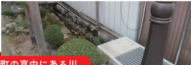
町の真中にある川

中野県庁の消滅後、昭和11(1936)年に建てられた中野町役場庁舎(今の陣屋・県庁記念館)の傍らにあります。夜間瀬川が形成した扇状地の傾斜に応じて施工された盛土造成の跡です。建物が焼失し、かつての敷地も宅地化して地形もすっかり変わってしまった中で、わずかに県庁(陣屋)の存在を伝えています。