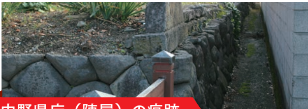
中野県庁（陣屋）の痕跡

今から150年前、わずか11か月だけ存在した中野県に焦点を当て、近世から近代へと移り変わる混沌とした時代の雰囲気を変えようとするものです。ここでは、企画展をより楽しむために、まちなかに残る中野県の痕跡を紹介します。