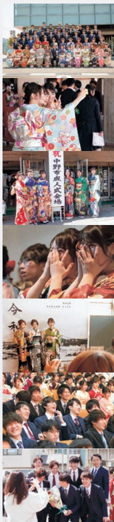
※写真は19年度成人式