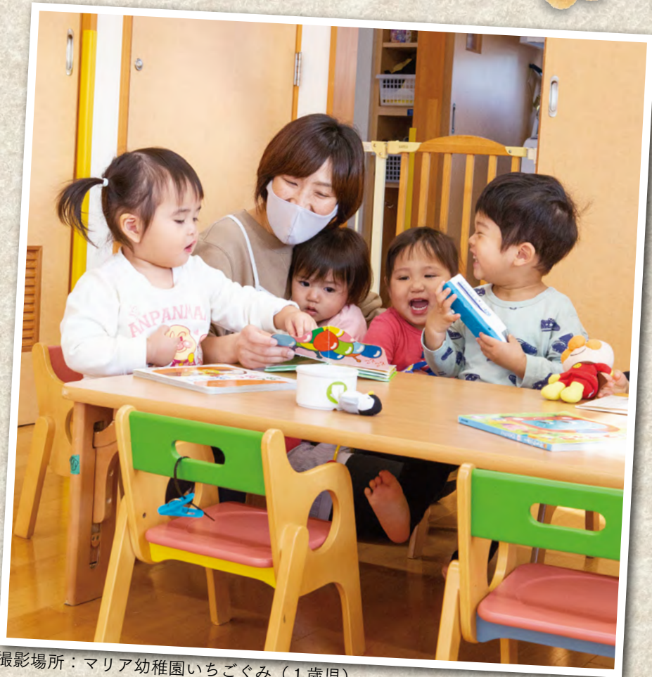
撮影場所：マリア幼稚園いちごぐみ（1歳児）

市では、多様化する就労形態に沿った保育サービスの充実を図り、さまざまな発育状況にある子供たちが、快適に集団生活を 送れるように取り組みを強化しています。保育に関する市の状況や、取り組みについてご紹介します。