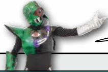
悪の組織 ハンゲーン