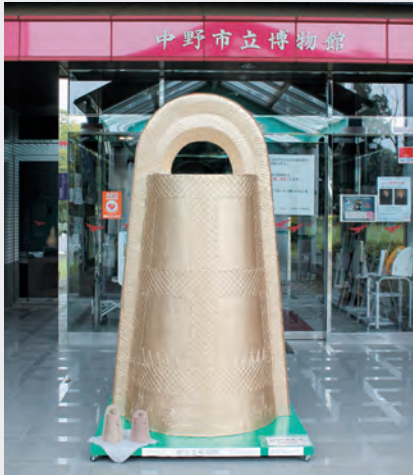
▲入り口には大きなモニュメントが登場！