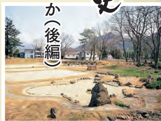
▲高梨館跡の復元庭園と建物遺構。

中野氏が氏寺を建てた場所は現在の高梨氏館跡にほかならないと筆者は推測する。その証拠を『高梨氏館跡―発掘調査報告書』によって明らかにしたい。この報告書には次のように記されている。