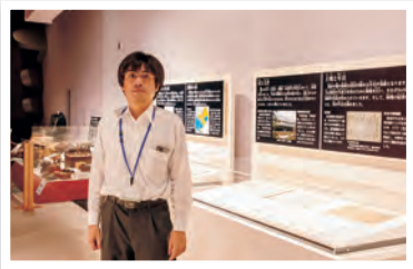
▲膨大な資料を整理し、貴重な情報を記録しています。

中野市を含め、長野県内には各地域に多くの歴史資料が残されています。古文書は和紙に墨で文字が記されていますが、その1点1点を整理用封筒に収納し、古文書からの情報（出所、作成時期、内容、差出人、受取人など）をもとに目録（リスト）を作成し、どこにどのような内容の古文書が残されているかを記録していきます。