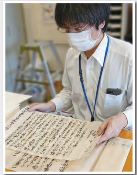
▲古文書からは当時の生活、人間模様などさまざまなことが読み解けます。