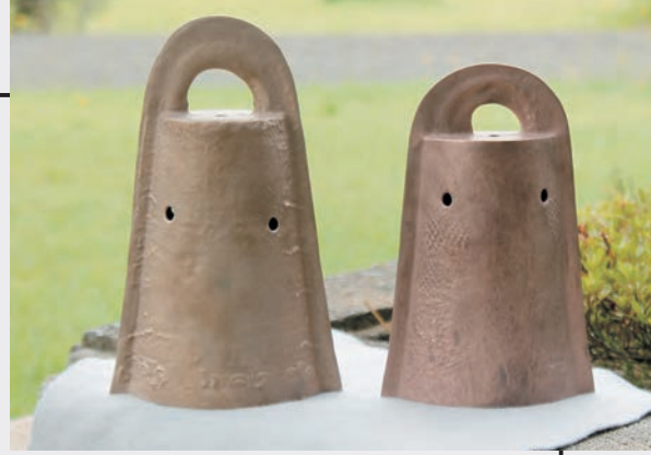
▲厚み、金属の成分など、これまでにない精密な複製です。