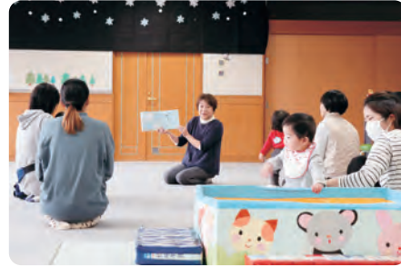
うさぎっ子で読み聞かせ (昨年の様子)