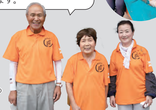
認知症サポーターの皆さん

認知症の方と一緒に、お庭で散歩したり、昔話をお聞きたり、私たち自身も楽しい時間を持っています。