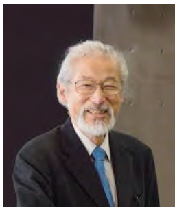
市民会館設計業務管理技術者

また、構成員の(株)宮本忠長建築 設計事務所(長野市)は、県内を はじめ全国の公共施設など多くの 施設の設計を手掛けている。