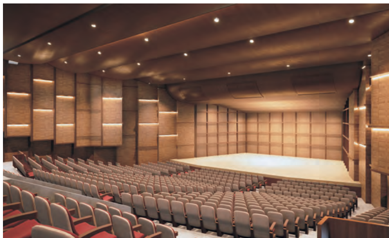
▲大ホールの内観イメージ

Q. 大ホールの客席数が約 1000 席から約 800 席に減 りますが、来場者が入りきらなかった場合の対 応は？