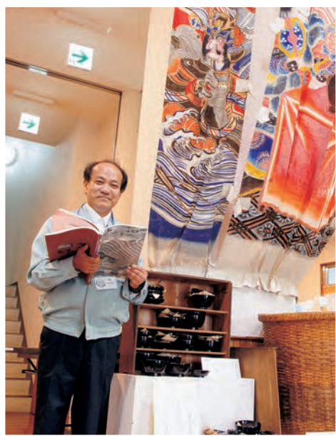
▲ロビーに展示してある収蔵資料は迫力満点