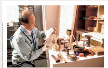
▲開催する展示の準備