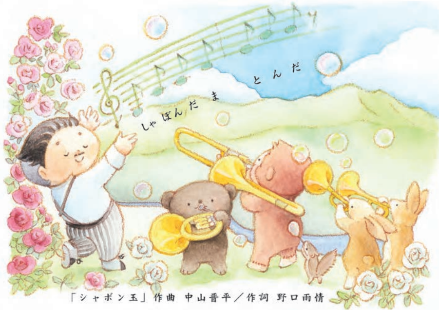
「シャボン玉」作曲 中山晋平 / 作詞 野口雨情