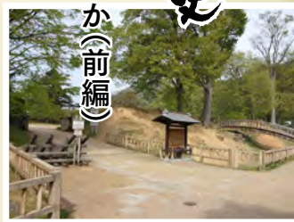
▲中野氏の氏寺と推測される高梨氏館跡。氏寺とは一族の霊をまつる寺のこと。

平安時代から戦国時代の中頃までの約670年間、今から約520年前まで、中野(現大字西条と中野)を本拠地として勢力を拡大した中野氏は、しだいに政治・経済上でも発展していった。