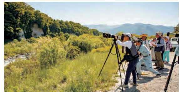
「十三崖チョウゲンボウ応援団」の活動の様子

チョウゲンボウは猛禽類ですが、その姿は愛くるしく、人を引き付けるものがあります。特に