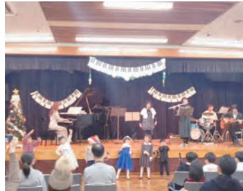
▲ミュージックスクール Tuttiと合同開催したクリスマスコンサートの様子