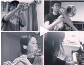
▲新型コロナによる自粛期間中に演奏動画を作成し公開

東京都武蔵村山市出身。5歳からピアノを始め、小・中学校の吹奏楽でフルートを始める。国立音楽大学大附属高校、同大学音楽教育科卒業。2009年に夫の故郷である中野市へ移住。13年～18年まで中山晋平記念館に勤務した後、19年より音楽教室「Joyride Music」を開業する。中学校、高校の音楽教諭免許のほか、メンタル心理ミュージックアドバイザー、音楽療法カウンセラーの資格を持つ。