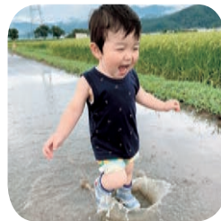
ふじまさき さくると 藤牧 朔土くん (2歳)

庶務課 ☎(22)2111(内線212) Eメール koho@city.nakano.nagano.jp