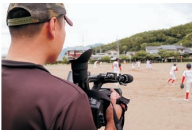
▲延徳小学校でちびっ子野球チームを取材。撮影した子どもや保護者が喜んでくれるのがとてもうれしいという。

最近では新たな映像制作のためにドローンとアクションカメラを導入。「番組制作だけでなくCMやHPなどに用いる映像制作でも力になります。ぜひお声掛けください」と意欲を燃やす。