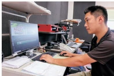
▲「ふるさと元気ッ子」編集集中。「中野市・山ノ内町で頑張っている中学生までの団体などの出演を募集中です！」