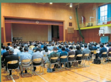
▲平岡小学校で行われた説明会の様子