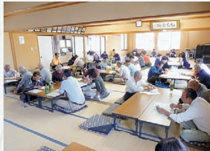
▲昨年度開催された懇談会

な事柄を題材に、人権について理解を深めることを大切に開催しています。人権啓発DVDを活用したり、講師・助言者のお話を聴いたりして「人権」について学習・懇談します。差別のない、あたたかな思いやりの心と、お互いが支えあう共生の社会を実現するため、皆さまのご協力をお願いします。