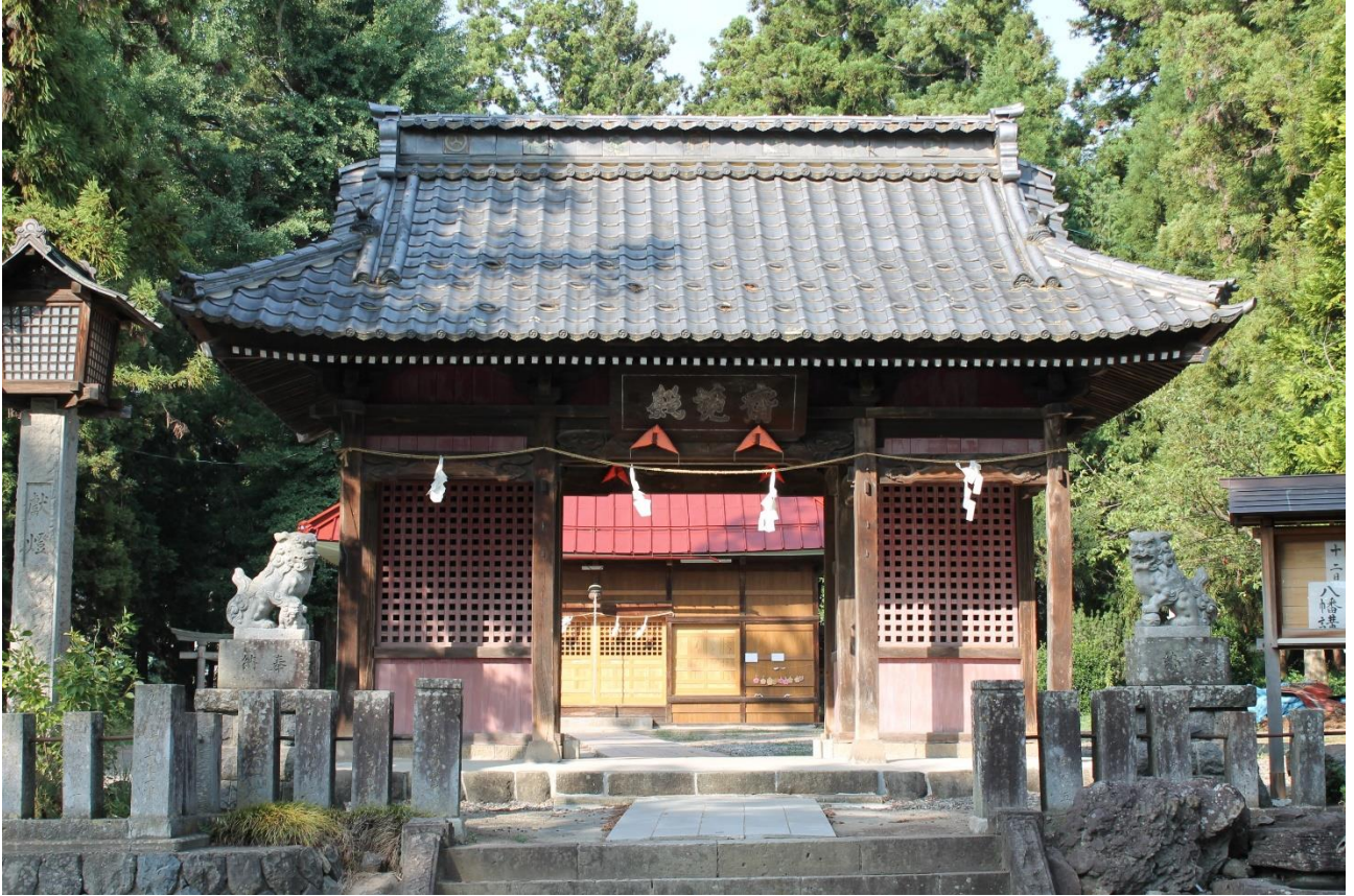
小内八幡神社随身門