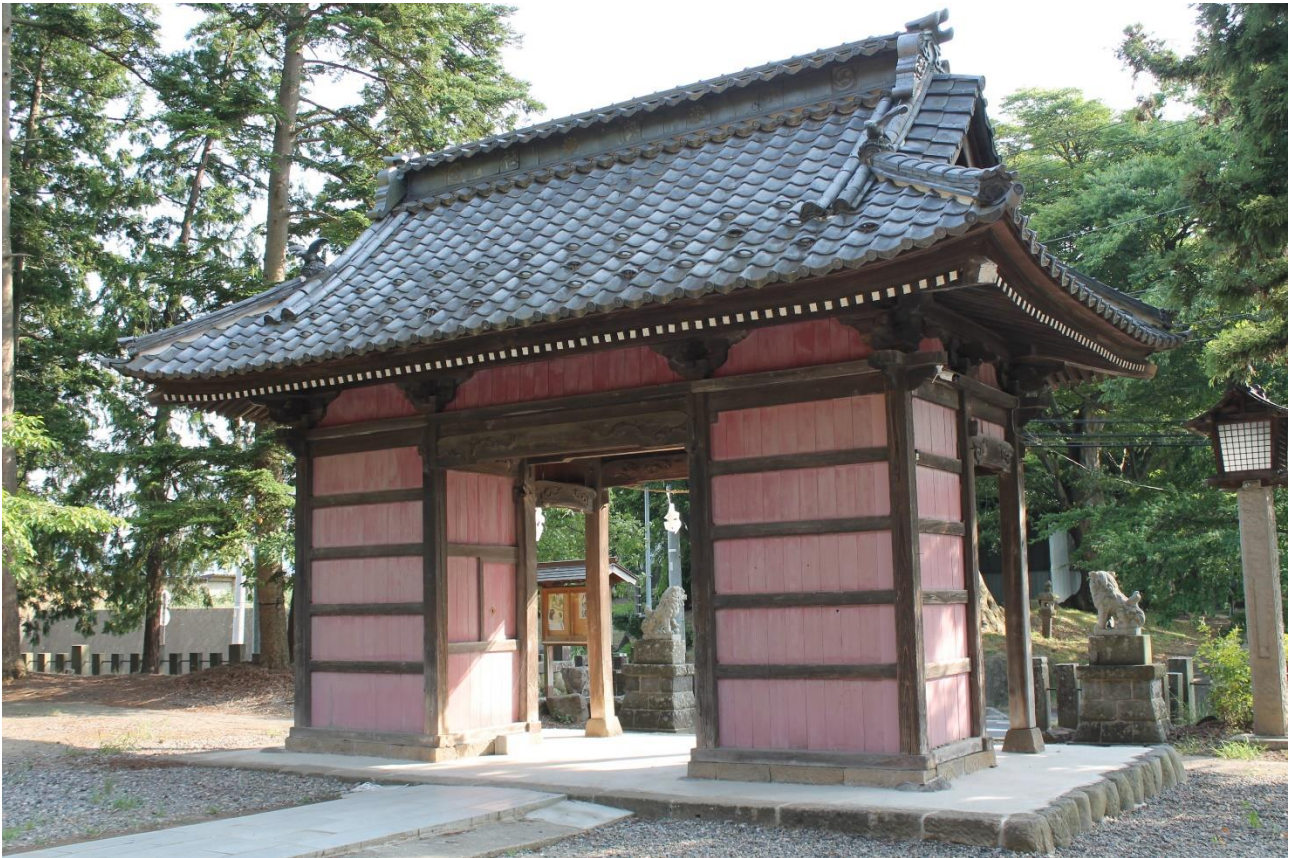
小内八幡神社随身門（裏側）