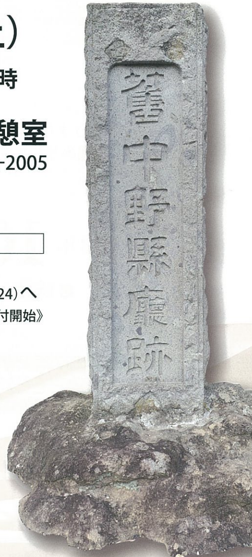
「旧中野県庁跡」石碑