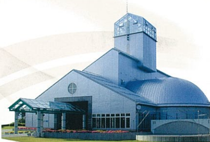
〔講演会場〕中野市立博物館

または 生涯学習課 ☎0269-22-2111 (内線424) へ 電話でお申込みください。《10月12日(月)より受付開始》