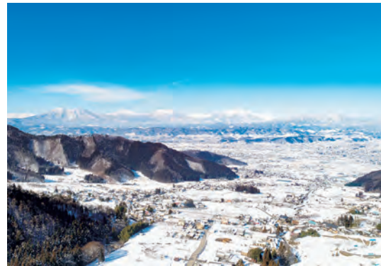
◀ ぼんぼこの湯から見える北信五岳がおススメです(写真はドローンで撮影)

さて、これら温泉を市民の皆さんはご利用したことがあるでしょうか。言うまでもなく、日本は火山国であり、温泉王国でもある。昔から、温泉に親しみ、温泉の健康効果を利用してきたが、いま、国内外を問わず、温泉は地域の重要な観光資源でもある。中野市の周辺には有名な温泉観光地が数多くあるが、