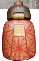
▲内閣総理大臣賞受賞のこけし「かのこ」