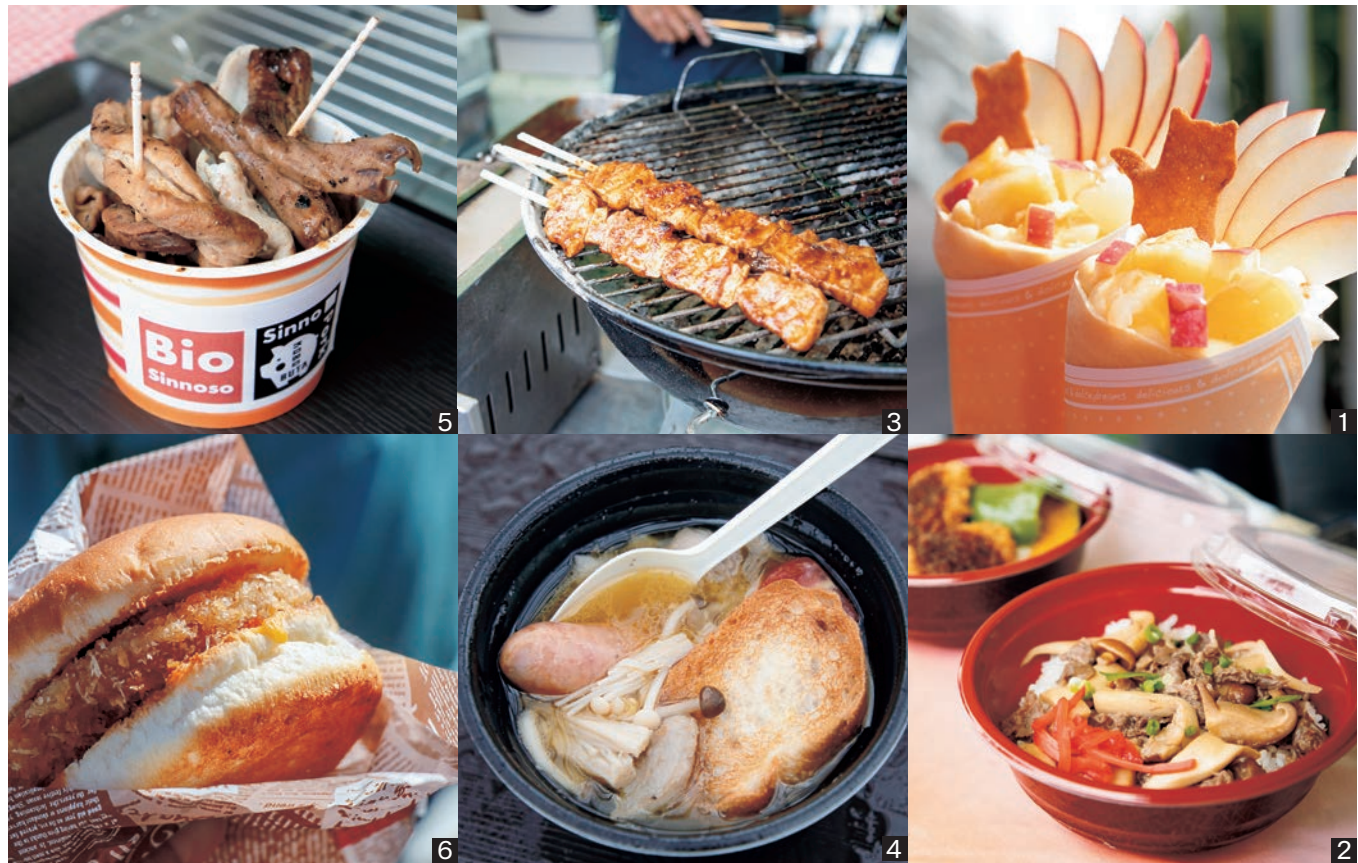
1 N-1グランプリに輝いた、信州りんごとキャラメルの生カスタード 2 牛肉入きのご丼 3 信州産豚とエリンギのBBQ串@信州みそダレ 4 おごっす〜ぶ 5 しん農パークもつ焼き(パイリング入り) 6 ハムカツバーガー(きのこ、リンゴ入り)