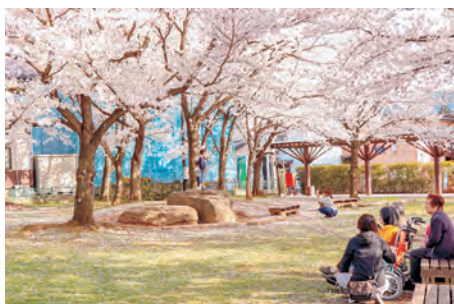
▲併設のオアシス公園の自然も魅力的。ソメイヨシノやヤマモミジなど約60種類の樹木が植えられ、四季を通じて楽しめます。

利用者が直接手に取って読むことができる「成人開架」に約6万冊。乳幼児から中高生向けの「児童開架」に約3万冊の本があります。このほか、普段は公開していない書庫に約12万冊の本を所蔵。合計の蔵書数は21万冊を超えます。