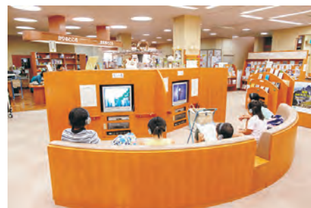
▲AVコーナー。休日はたくさんの子供たちでにぎわう人気のスポットです。