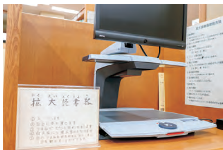
▲拡大読書器。ほかにも録音図書や点字図書、大活字本など、目の悪い人にも本を楽しんでもらえるよう工夫がされています。