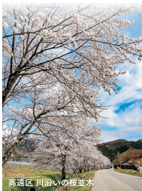
高遠区 川沿いの桜並木