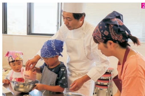
1_子ども教室「プラ板でくるくる万華鏡を作ろう！」(西部公民館) 2_夏休み親子食育講座「もっと知ろう砂糖の世界」(北部公民館) 3_夏休み親子切り絵教室(中央公民館)