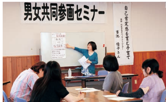
▲2回目の男女共同参画セミナーの様子

止めることが大切です。このことが出来るようになるために、セミナーではワークシートを使って自分や出来事を客観的に