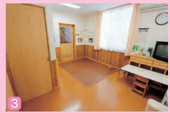
1_ 病児・病後児保育施設。北信総合病院たんぼぼ保育園隣にあります。