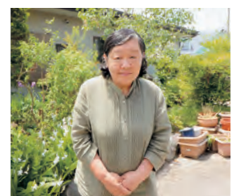
おまかせ会員の声

「子育て中の人たちが何かサポートできないか」と考えていたとき、この制度が始まりました。私自身、多くの人たちに支えられて育ちました。そんなことが根っこにあるので、公民館の託児などもやっています。制度開始からずっと、多くの子どもを預かってきましたが、いつも楽しく、素敵な時間を過ごさせていただいています。あまり重く考えず「子育て中のお母さん、お父さん」に何かできないか」と少しでも、思う方は登録してみてください。はいかがでしょうか。