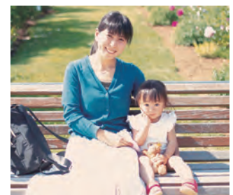
おねがい会員の声

県外から移住してきて、近くに子どもを預けられる身内がない私たちのような人は多くいると思います。よく知らない環境の中で、子育てをするのはとても不安です。初めて子どもを預けるときは不安だらけでしたが、子どもを迎えに行き、子どもと過ごした時間で起きたことを細かく報告いただくと、不安が取り除かれました。何度か子どもを預けているうちに、信頼関係もできたとおもいます。ときには、相談に乗ってもらったりもしています。保育園とはまた違った安心感があります。