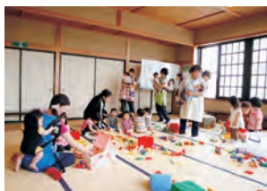
公民館託児の様子

「子育て中の人たちが何かサポートできないか」と考えていたとき、この制度が始まりました。私自身、多くの人たちに支えられて育ちました。そんなことが根っこにあるので、公民館の託児などもやっています。制度開始からずっと、多くの子どもを預かってきましたが、いつも楽しく、素敵な時間を過ごさせていただいています。あまり重く考えず「子育て中のお母さん、お父さん」に何かできないか」と少しでも、思う方は登録してみてください。はいかがでしょうか。