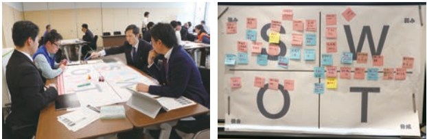
▲市職員(シティプロモーションチームメンバー)で行ったSWOT分析の様子。中野市のS(強み)、W(弱み)、O(機会)、T(脅威)を出し合いました。