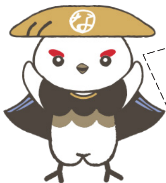
学び応援キャラクター「信州なび助」 ©長野県教育委員会信州なび助

平成 20 年に社会教育法が改正され、学校、家庭、地域住民等の連携、協力の促進に努めることとなりました。また、平成 29 年の社会教育法改正により、市町村教育委員会が地域住民等と学校との連携・協働体制を整備することが明記されました。