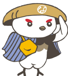
学び応援キャラクター「信州なび助」 ©長野県教育委員会信州なび助

社会教育委員になられた皆さんの 疑問にお答えします。 社会教育委員の役割などについて 理解して、よりよい地域社会を つくっていきましょう。