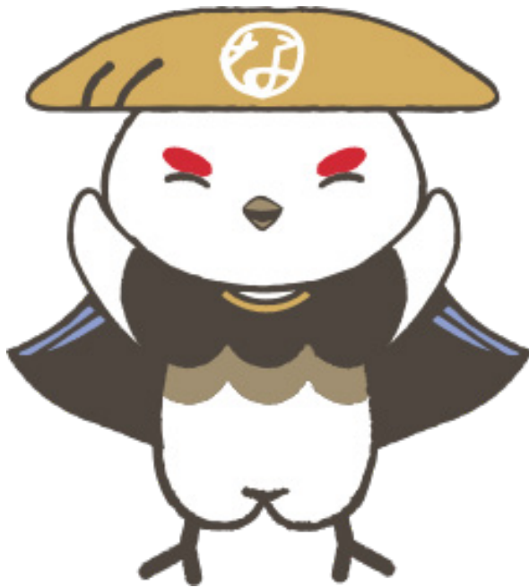
学び応援キャラクター「信州なび助」 ©長野県教育委員会信州なび助