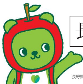
長野県 PR キャラクター「アルクマ」 ©長野県アルクマ