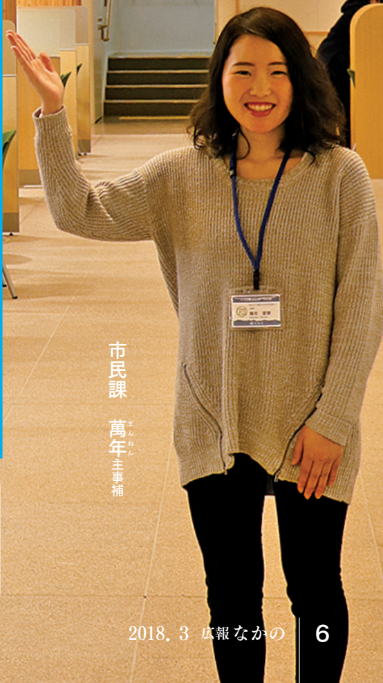
市民課 萬年主事補