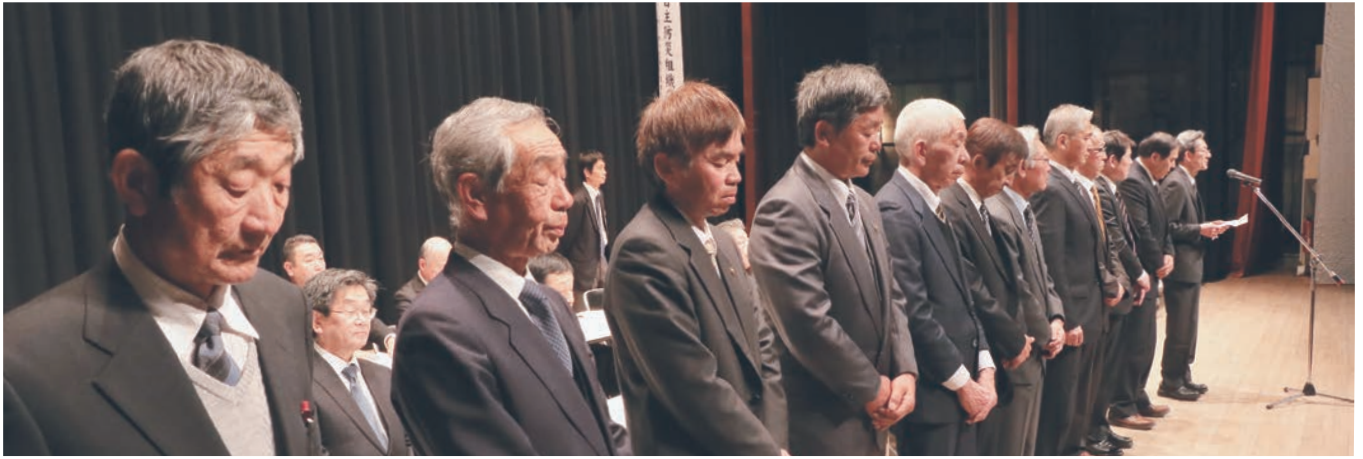
▲ 2月20日の中野市区長会定期総会で選出された役員の皆さん