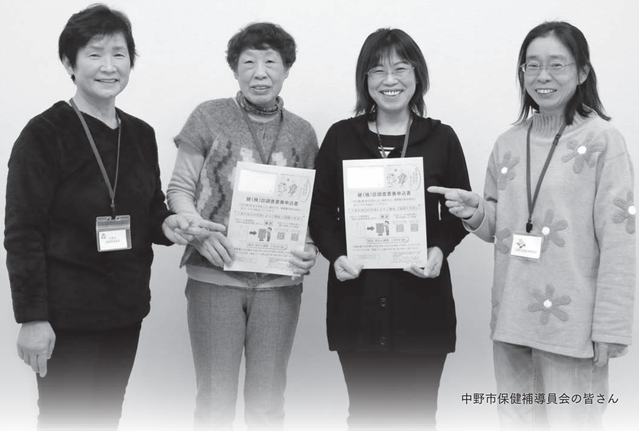
中野市保健補導員会の皆さん