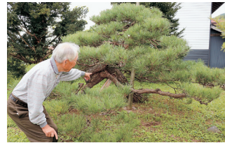
▲長い年月、風雪に耐えた松の木

「わが家の宝」の松の木が自慢です。明治時代から風雪に耐えたもので、幹が大きく曲がっています。また、壁田区で行われる6年に1度の御柱祭も見事です。氏子たちが引く台車の上にある御柱には、赤い着物を着た区の年長者が乗ります。次の御柱祭がすでに楽しみです。