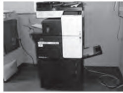
▶東吉田区で整備した複合機