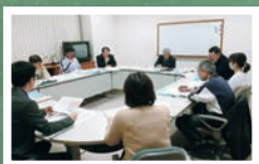
▲豊田地域 地域・PTA部会の様子