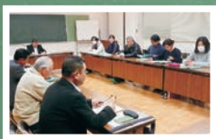
▲北部地区 通学・安全部会の様子