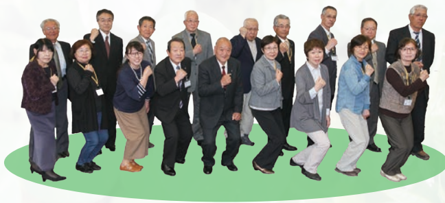
▲民生児童委員の皆さん

配食サービスや看護師による訪問相談などの高齢者のみの世帯向けサービスのほか、福祉医療費に関して、行政や社会福祉協議会などにつなぐ役割を担っています。「福祉のことを知っている身近な人」として、相談内容に応じて必要な支援を受けられる専門機関などをつなぎ、課題が解決できるよう地域住民に寄り添います。