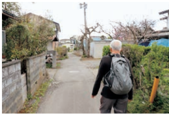
▲自分の担当する区を歩いて地域の様子をパトロール。

地域の情報を同じ住民の立場で収集します。「郵便物がたまっていないか」、「怒鳴り声と子どもの泣き声は聞こえないか」。家の外からでも発見できる異変をパトロールで確認します。