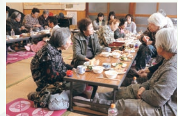
▲家に閉じこもりがちな高齢者が身近な場所でおしゃべりやお茶飲みを楽しめる場を企画します。

また、このお茶会以外にも、小学校の運動会や音楽会を見に行くなどさまざまな企画で高齢者と地域をつなげ、地域に元気を作り出しています。