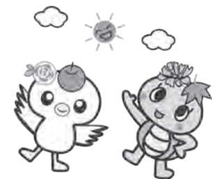
健康くん 元気くん (健康長寿のまちシンボルキャラクター)