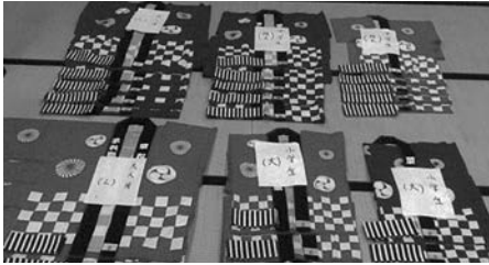
▲栗和田区で整備した祭半天

宝くじの社会貢献広報事業として、宝くじの受託事業収入を財源として実施している「コミュニティ助成事業」を活用し、栗和田区では祭半天などを整備しました。