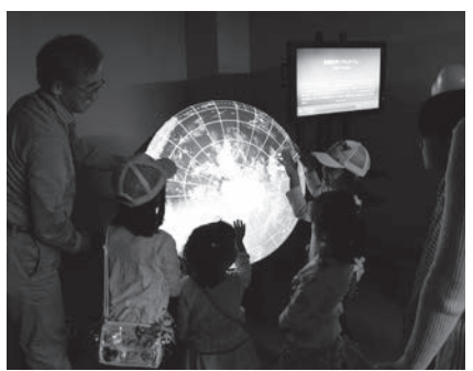
▲昨年の信州中野環境祭の様子

時間 午前10時～午後3時 会場 中野勤労者福祉センター 内容 環境に優しい製品など の展示販売、企業・団体ブ ース、各種体験や工作コーナー、 飲食コーナー、フリーマー ケットなど