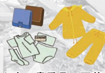
お金、貴重品、下着、防寒具など