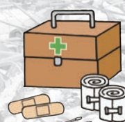
救急医療品、常備薬