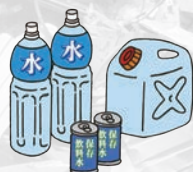
飲料水 (1人1日3リットルが目安)