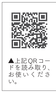
▲上記QRコードを読み取り、お使いください。

なお、登録は無料ですが、メールおよびインターネットの通信料金は、登録者の負担となります。 どなたでもご利用いただけます。